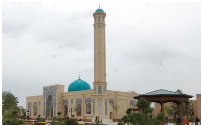
Рис. 2. Ансамбль Занги-ата (2018 г.)

В настоящее время смысл и назначение многих культовых объектов приобретает свой изначальный смысл, они становятся объектами поклонения и объектами познания. Следовательно, религиозные ценности – это часть культурного наследия и объекты туризма. Необходимо отметить что, религиозный туризм играет большую роль в системе международного и внутреннего туризма. Религиозный туризм является составной частью современной индустрии туризма. У него есть свои разновидности: паломничество и познавательные туры религиозной направленности.