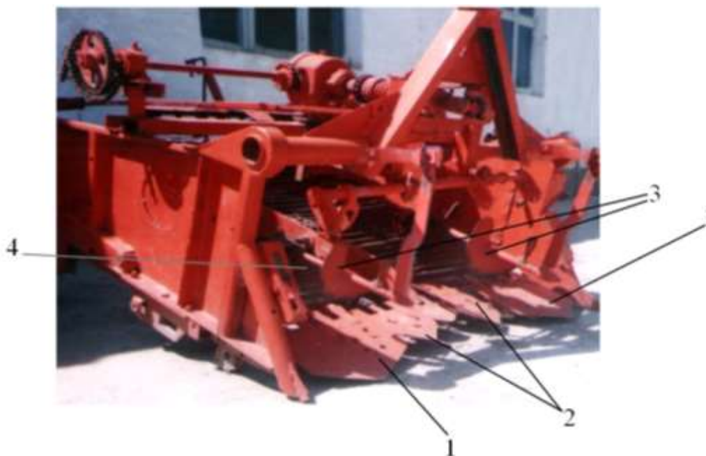
1- основные плоские подкапывающие лемеха; 2 - промежуточные лемеха; 3 - транспортирующие шнеки; 4-сепарирующий рабочий орган